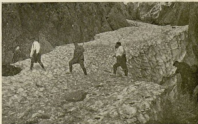
Subida a la fuente del Cristal, atravesando el canal del mismo nombre, de nieves perpetuas

Precisa entonces caminar a pie por las fortísimas pendientes, hundiendo la culata de la