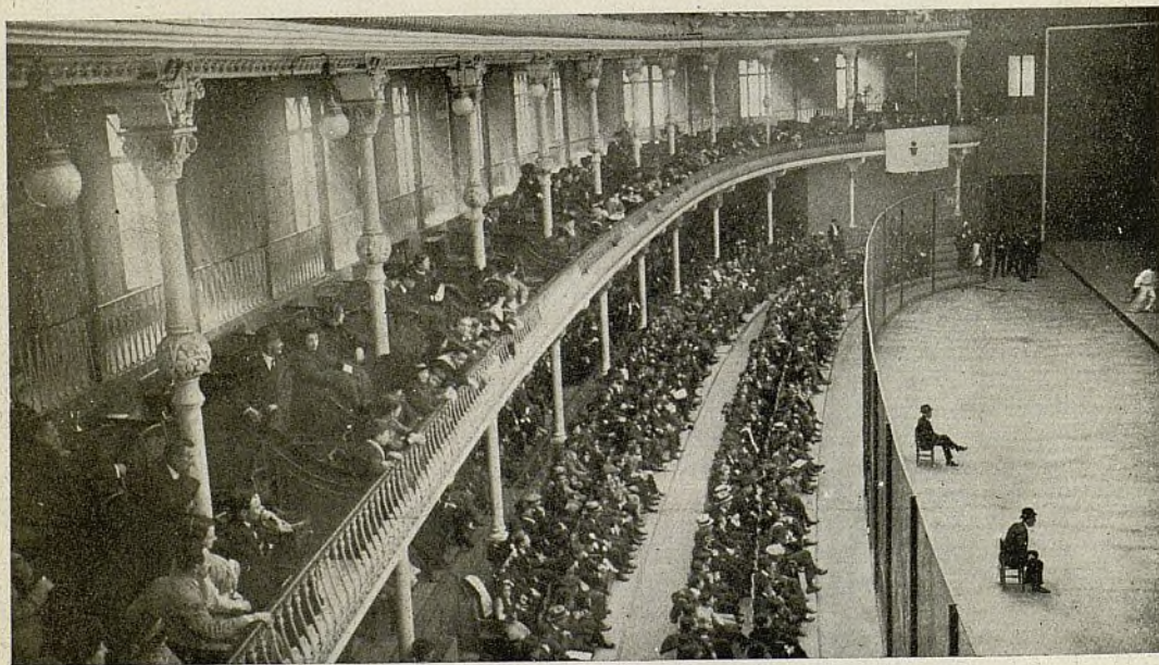
Brillantísimo aspecto que ofrecía el Frontón Condal el domingo último

No podemos terminar estas líneas sin hacer constar que los dos partidos jugados con ocasión de este importante acontecimiento deportivo resultaron dos bellas manifestaciones, y en especial el primero de ellos.