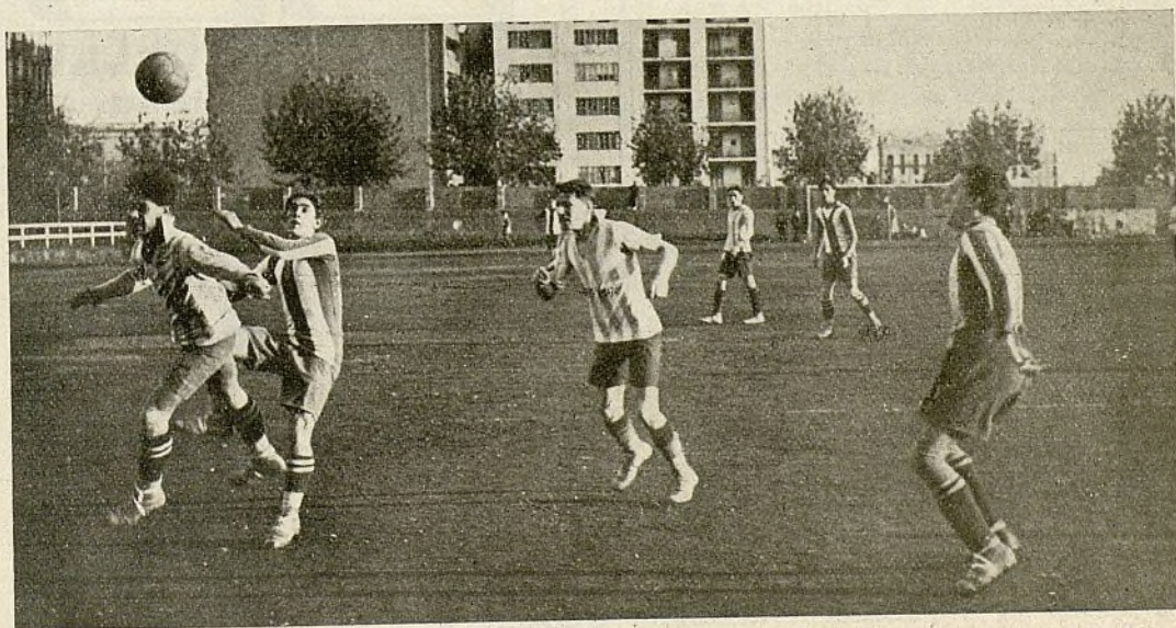
Los equipos Español e Internacional, durante el primer encuentro del Campeonato de Cataluña

cuyo trofeo se lucha gran parte de la temporada, proporcionando encuentros tan hermosos como el que tuvo lugar el domingo pasado, con el resultado de 2 goals a 1 a favor de los encarnados.