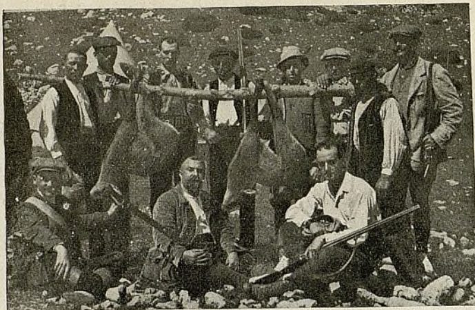
Grupo de cazadores con las piezas cobradas

Y en medio de esa decoración sublime, intransplantable a ningún telón de fondo por hábil que fuese el pincel del más reputado de los escenógrafos, los cazadores recorren la sierra