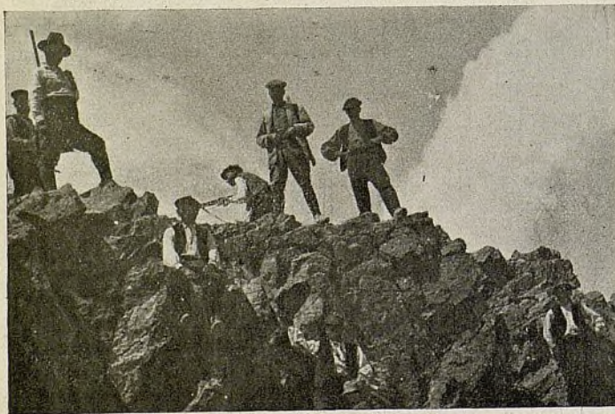
Los cazadores en la cumbre del Cadi (2.500 metros de altura)