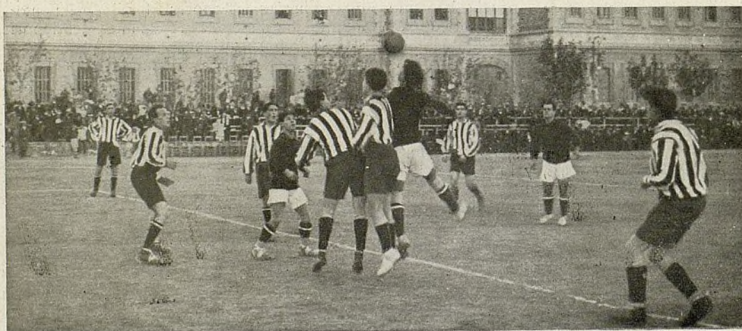
Athletic de Madrid-España. — Los matritenses en la defensa de su meta.

He aquí, pues, la causa de que los partidos jugados entre gallegos y catalanes hayan resultado lucidos y de provecho para los segundos del Barcelona, quienes, además de lucirse, como hemos dicho, obtuvieron la victoria.