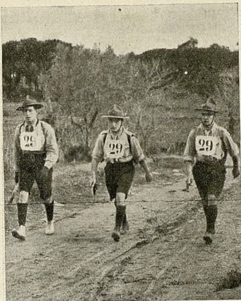
Uno de los equipos de Exploradores, que tan excelente papel representaron en la cursa

de Sant Llorenç del Munt, venció asimismo en la segunda prueba, quedando, según lo reglamentado, en posesión definitiva de la magnífica Copa.