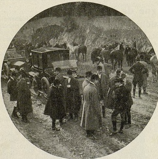
El «rendez-vous», en las inmediaciones de la Torre del Baró