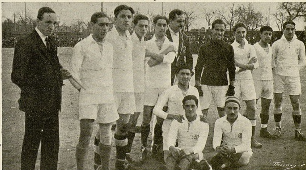
Equipo del Sevilla F. C., que ha quedado Campeón

Sin embargo, es mucho peso el once rojo cuando nacen en él los vehementes deseos de la victoria, y he aquí que en la segunda parte, enardecidos por la furia del Internacional, lograron no sólo imponerse a sus contrarios, sino ganarles por tres tantos contra el único que habían obtenido.