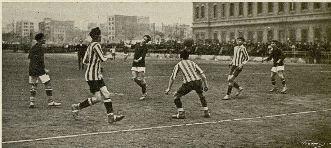
Detalle del partido España-Internacional, que ganó el primero por 3 goals a 1

EN el encuentro entre el España y el Inter se demostró de una manera que no deja lugar a dudas, lo mucho que progresa el equipo blanco y verde.