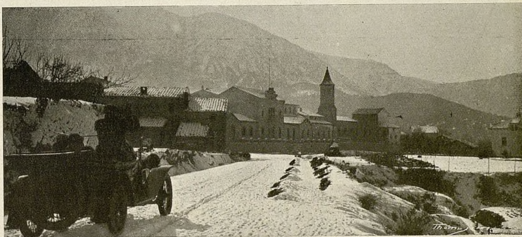
El pueblo de Viladrau visto desde la entrada del mismo por la carretera de Arbucias