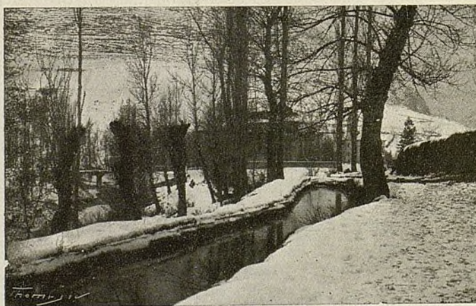
Camprodon. Pintoresco camino de la Font dels enamorats

Acerca de este proyecto, debidamente madurado, hablaremos otro día.