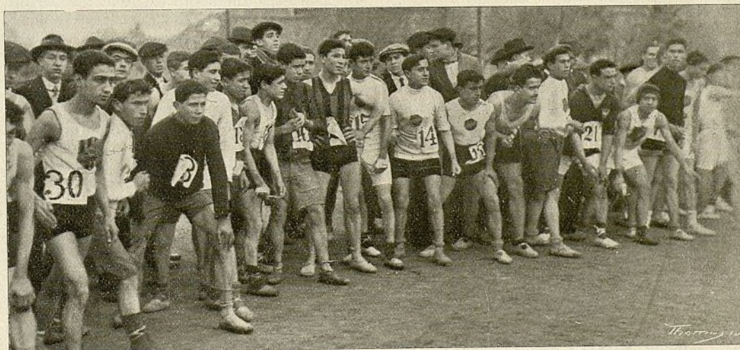
Los concursantes, en el momento de la salida

NO fué tampoco escaso el éxito alcanzado por el Centre Excursionista Montseny con motivo de la carrera a pie, disputada por los atletas neófitos de dicha entidad.