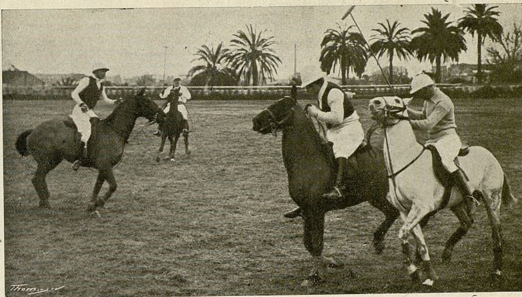
Un interesante momento del último partido

CUANDO, acabada la guerra, llegue la hora de la gran reacción deportiva y se organicen los grandes certámenes que habrán de poner en parangón la pericia y superioridad en el ejercicio, no sólo de las naciones, sino la de las mismas regiones, es indudable que a los equi-