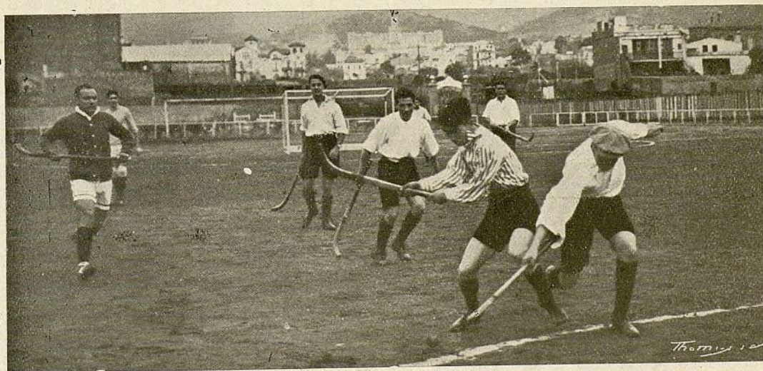
Un ataque del equipo del Real Polo Jockey Club

MERCED al entusiasmo de unos cuantos distinguidos deportistas, el hockey en Barcelona empieza a adquirir carta de naturaleza.