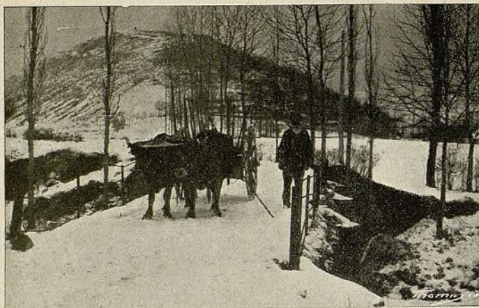
Un hermoso cuadro de invierno en las cercanías de Camprodon

como pocos a practicar el turismo en todos sus matices, por aquello que «atesora un conjunto de bellezas naturales, tan abundantes, tan espléndidas y tan diversas, que no parece sino que la Naturaleza ha querido hacer en él un paraíso, donde poner, en muestra, todas las maravillas que la creación esparció por la tierra.»