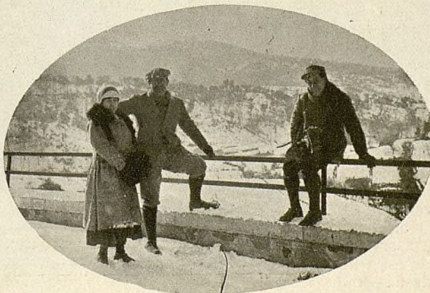
Contemplando el paisaje durante un descanso

los que no han adquirido su bicicleta, su moto o su automóvil sino para poder hacer turismo a su manera y con los medios de que cada uno dispone. Pero son relativamente pocos los que practican el turismo, si se compara con el desarrollo que ha obtenido éste en otros pueblos y si se tiene en cuenta que nuestro país se presta