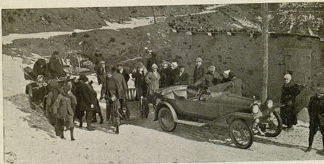
Grupo de automóviles y automovilistas, en las proximidades de Ribas