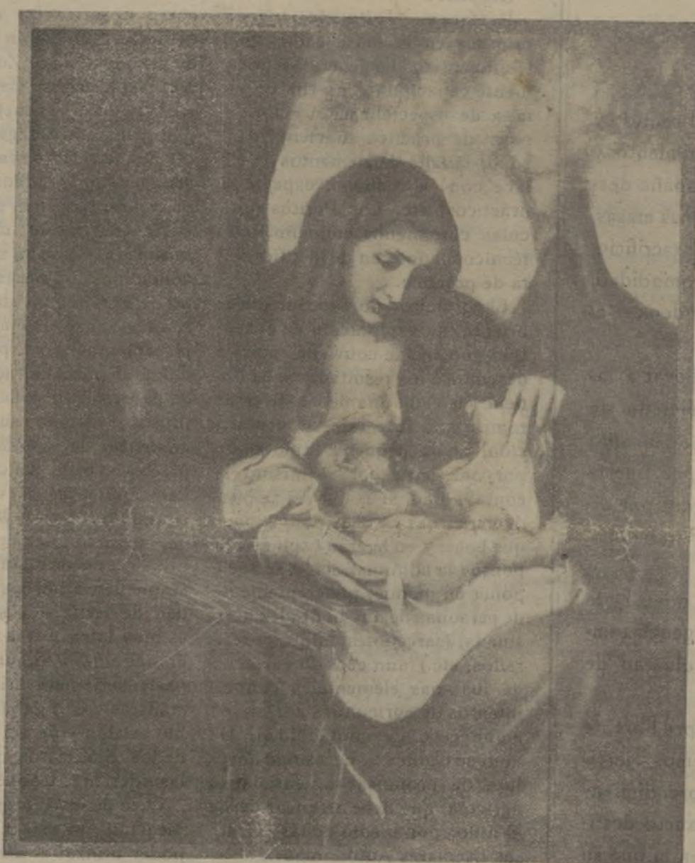
Galería Nacional - Roma.