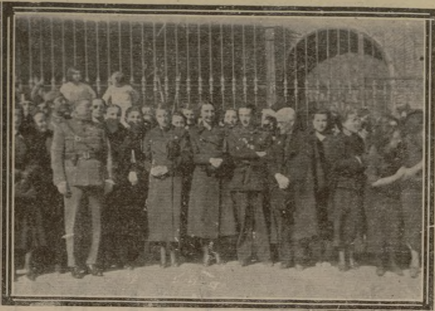
Las Autoridades y Jefes de la Falange presencian el desfile de Flechas y 2.ª línea.