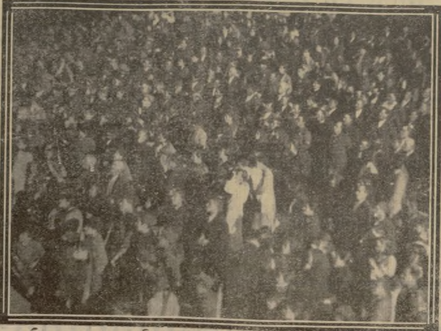
Aspecto parcial que ofrecía la plaza de Madrigal en el momento del acto de la Falange.