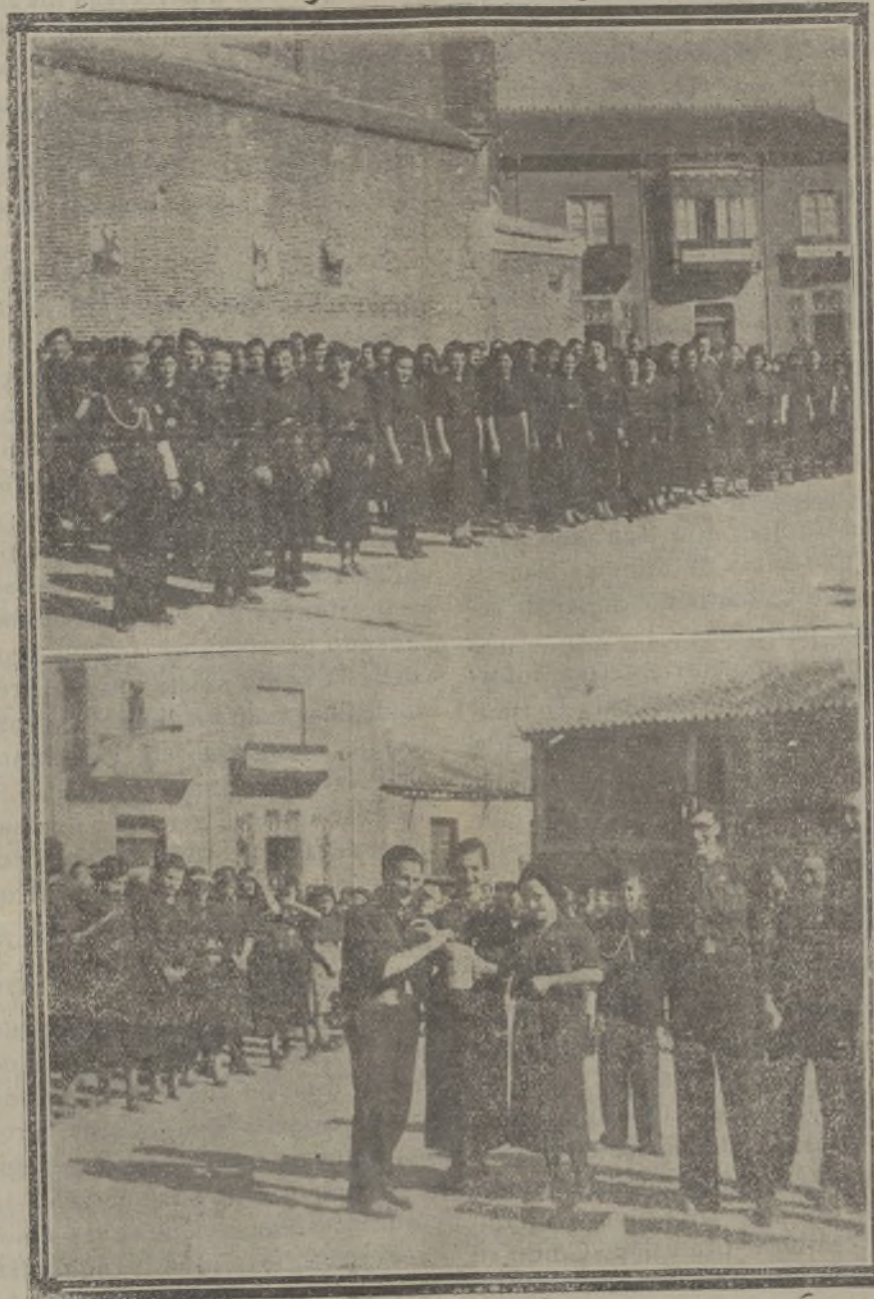
Arriba.—Un grupo de Camaradas de la sección Femenina de Madrigal de las Altas Torres disponiéndose a postular en la cuestión de Auxilio de Invierno.