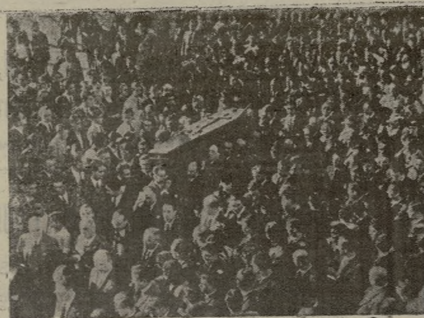
A la derecha: El cadáver del señor Calvo Sotelo, en la capilla ardiente. —A la izquierda: Un momento del entierro del llorado patriota. (Las precedentes fotografías nos fueron tachadas por la censura, el día 16 de Julio de 1936).

«¿Es que no recordamos—dice en su discurso el señor Gil Robles—aunque las facultades presidenciales, interviniendo oportunamente, quitaran ciertas palabras del «Diario de Sesiones», que el señor Gauziza, perteneciente a uno de los grupos que apoyan al Gobierno, dijo en el Salón de Sesiones—yo estaba presente y lo vi—que contra el señor Calvo Sotelo toda violencia era ilícita? ¿Es que acaso esas palabras no implican una excitación, tan cobardes como efícaz, a la comisión de un delito gravísimo? ¿Es que no implica una responsabilidad para el Gobierno que se apoya en quien es capaz de hacer una excitación de esa naturaleza?... Cuando desee la Cámara del banco azul se dice que el Gobierno es un burlador? ¿Quién puede impedir que los agentes de la autoridad lleguen en algún momento hasta los mismos bordes del crimen?»