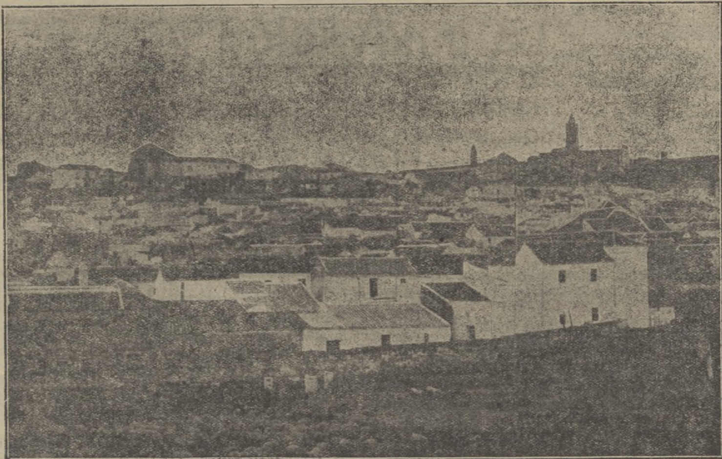
MEDINA SIDONIA.—Vista general de la población