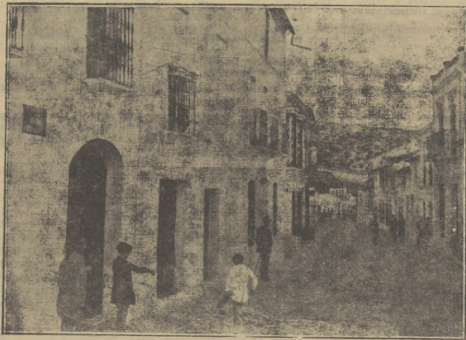
ALCALA DEL VALLE.—Calle de Primo de Rivera