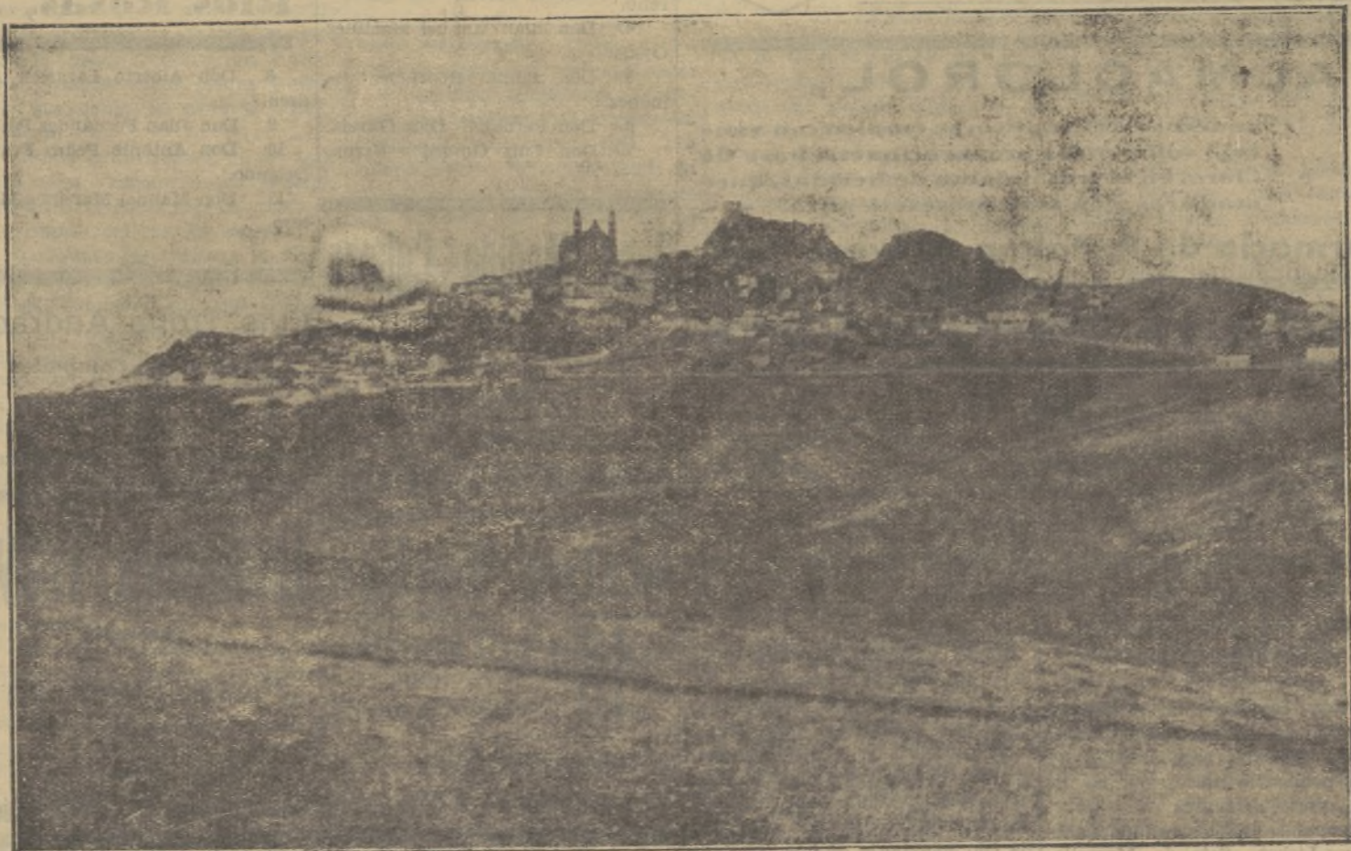
OLVERA.—Vista general desde la carretera de Algodonales

Rios Rosas, 36. - Tlfno. 9.-Olvera (Cádiz)