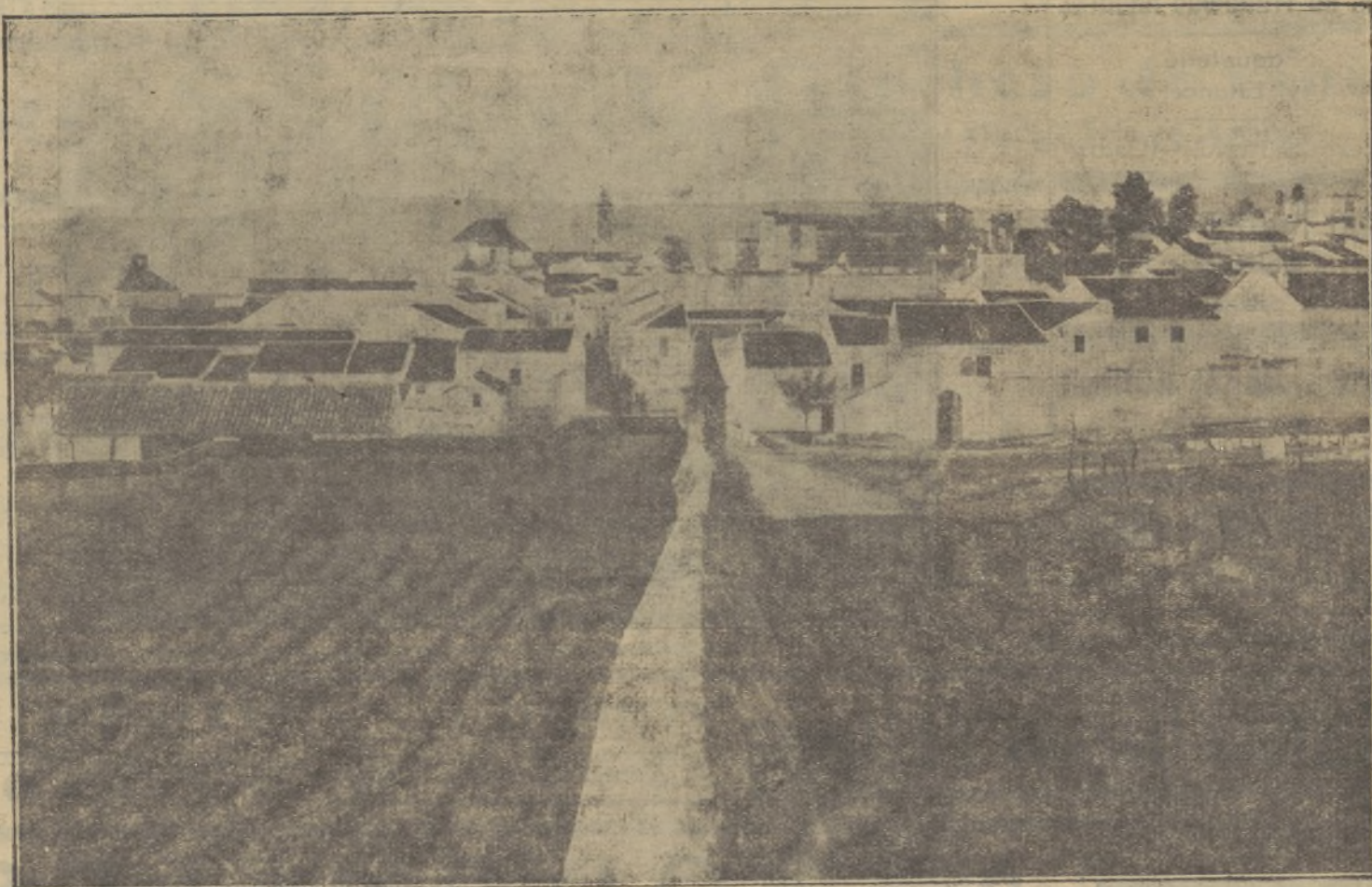
BORNOS. Vista general