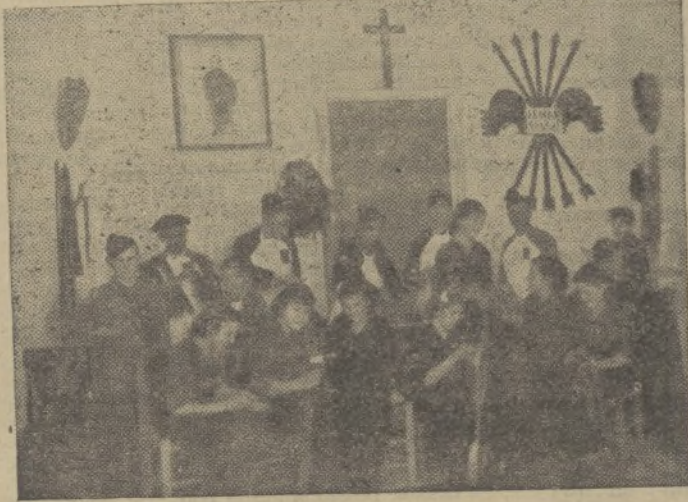
Un taller Nacional-sindicalista, en Ubrique

Al exterior, nada más. Penetro para saciar mi curiosidad y tras de recorrer las dependencias conocidas, se ofrece a mis ojos un cuadro que no pude imaginar: Bajo un Crucifijo que preside y ante el retrato del Ausente que dirige y el Haz que agrupa, veo una mesa de trabajo con unas herramientas de guarnicionería, unos pedazos de