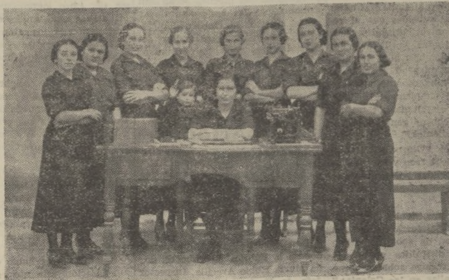
Mando de la Falange Femenina de Conil, y algunas afiliadas

Con Dios haremos proezas y él aniquilará a nuestros enemigos.