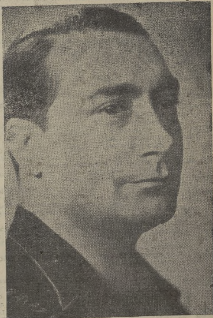
NUESTRO JEFE EL CAMARADA MANUEL HEDILLA