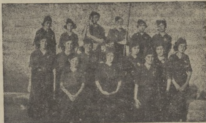
Falange Femenina de Puerto Serrano