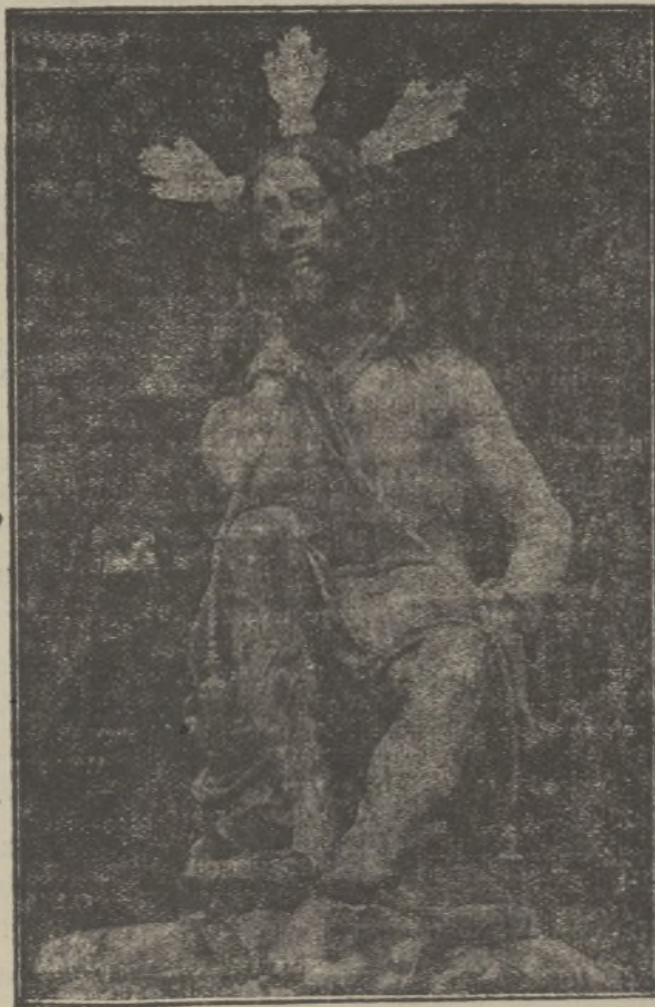
Nuestro Padre Jesús de la Humildad y Paciencia

Wilkins, dice que a trescientos kilómetros de Svalbard, el sumergible tendrá que navegar ya bajo el hielo. La travesía será de 3.200 kilómetros, y después de atravesar el círculo polar, el sumergible hará rumbo al Mar de Behring, procurando establecer la situación exacta de la Tierra de Croker que, caso de existir, cree Wilkins debe pertenecer a Canadá.