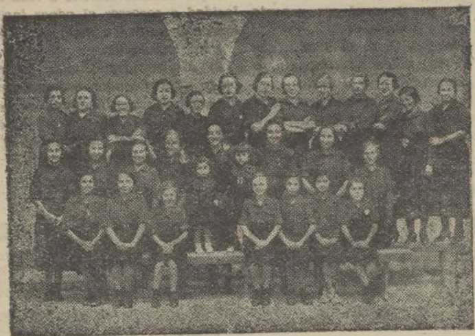
Falange Femenina de Conil