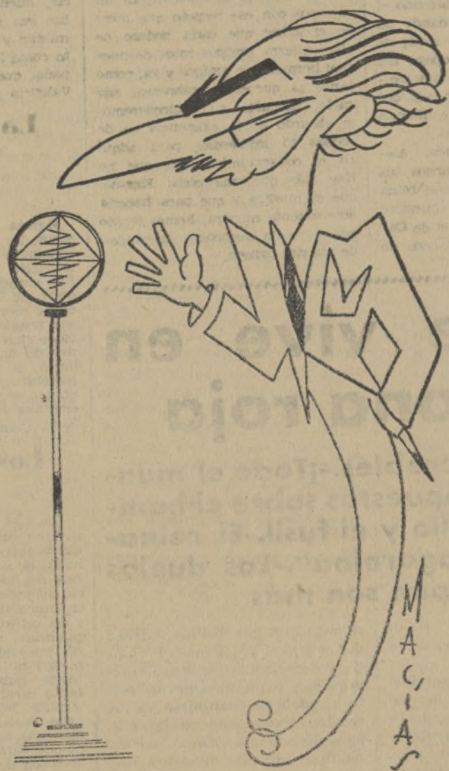
El ilustre poeta José María Pemán

Una vez más la voz de Pemán, en alas de su inagotable fantasía, arranca salvas de aplausos atronadores.