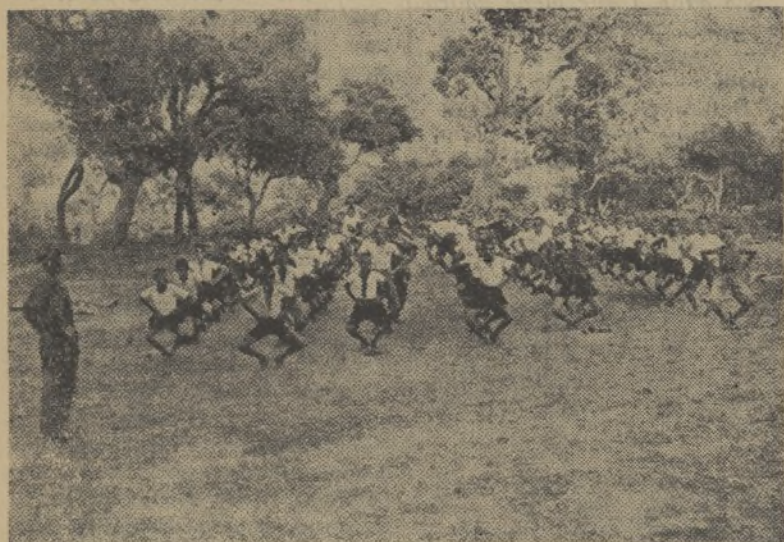
Ejercicios gimnásticos que efectúan diariamente bajo la dirección del camarada delegado de Juventudes.