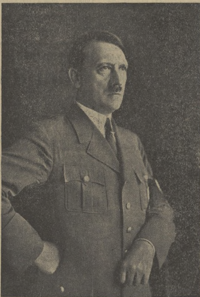
Notas de un condenado, preso en la fortaleza de LANDSBERG AM LECH.