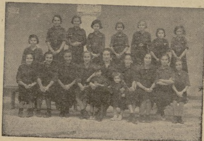
Las Flechas de Conil

Basta ya de ficciones y rastreo. Al palenque de la nueva España hay que saltar con la cabeza y con el brazo en alto, serenos y orgullosos, sin estridencias ni alharacas, dispuestos a la lucha y al sacrificio; no con el aspecto ridículo del adulador hipócrita, ni con la chillona algarabía de los habilitados, capaces de hundirnos nuevamente en las negruras sin fondo de una noche torturante y cruel."