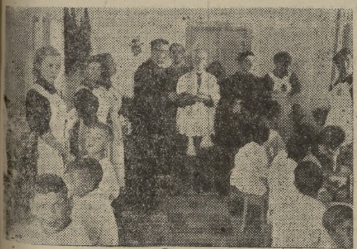
Después de la bendición