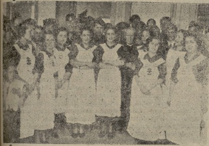
Línea de la Concepción.—Camaradas afectos a los comedores de auxilio de invierno, recientemente inaugurados.

Los tribunales del Estado condenaron a más de 8.000 religiosos, rabinos, monjes, monjas y predicadores de las más diversas comunidades, a prisión. A muerte fueron condenados 102 religiosos. Son objetos de especial persecución, los eclesiásticos de la llanura, que continúan ejerciendo sobre el pueblo gran influencia.