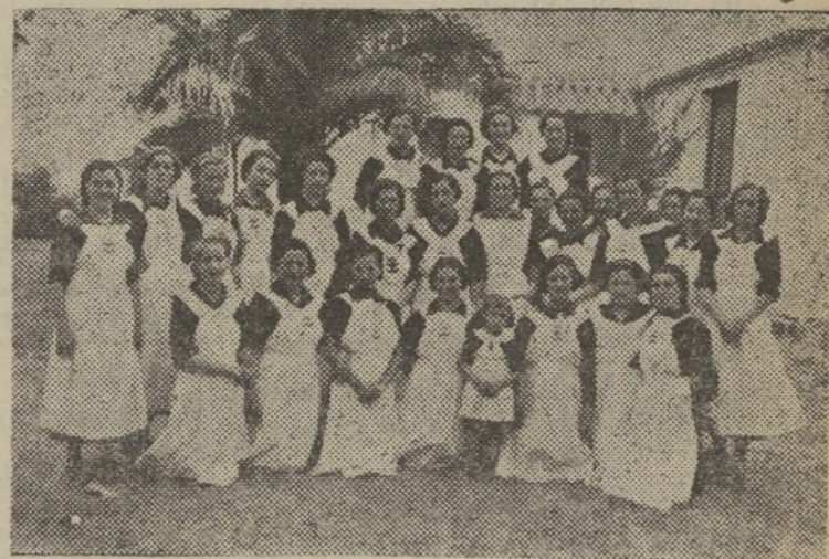
Camaradas de la Sección Femenina de La Línea, que tienen a su cargo los comedores de "Auxilio de Invierno"

La Oración de la Falange tendrá lugar, como siempre, el sábado 15, a las 8 y 30.