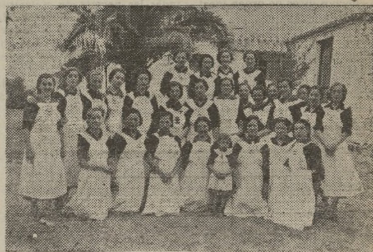
Camaradas de la Sección Femenina de La Línea, que tienen a su cargo los comedores de "Auxilio de Invierno"

La Oración de la Falange tendrá lugar, como siempre, el sábado 15, a las 8 y 30.