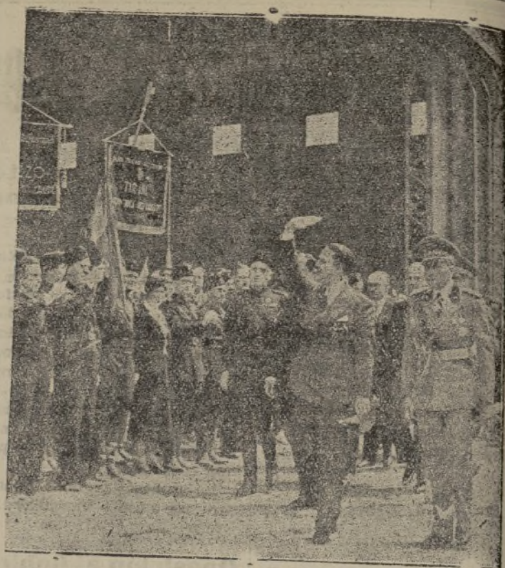
S. E. el Conde de Ciano pasa revista a los fascistas de Tirana

Por su parte estos bravos muchachos, que brevedad la hora en que han llegado a la España nacional no pueden disimular su satisfacción sin límites ante la vida que observan en la España de Franco, por la que ellos esperan luchar con todo entusiasmo, a fin de defenderla de la bestia moscovita.