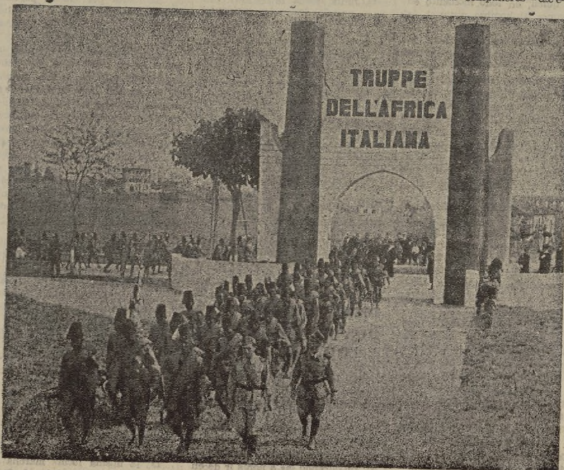
La primera vez que han desfilado por las calles de Roma, con motivo del primer aniversario de la fundación del Imperio, las tropas indígenas que tomaron parte en la conquista de Abisinia. — Varios de los escuadrones etíopes a su llegada al cuartel

Despachos: P. Iglesia, 66 y Real, 176 - Tlfos. 136 R. y 280 P. - S. FERNANDO