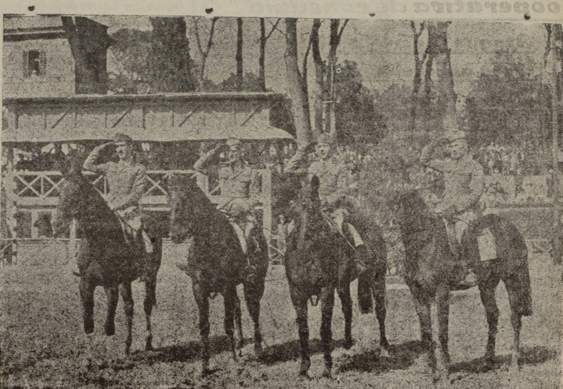
Equipo militar italiano que ganó el Gran Premio en el Concurso hípico celebrado en Florencia.