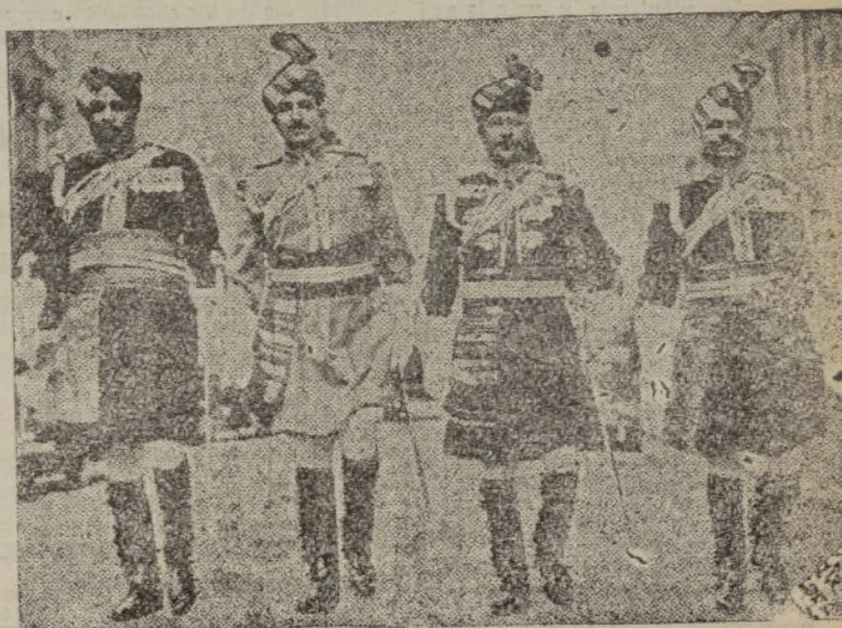
Para la fiesta de la coronación han llegado a Londres representantes de todas las fuerzas armadas del Imperio. He aquí unos oficiales de los regimientos indígenas indios, que lucen por las calles de Londres sus vistosos uniformes de gala