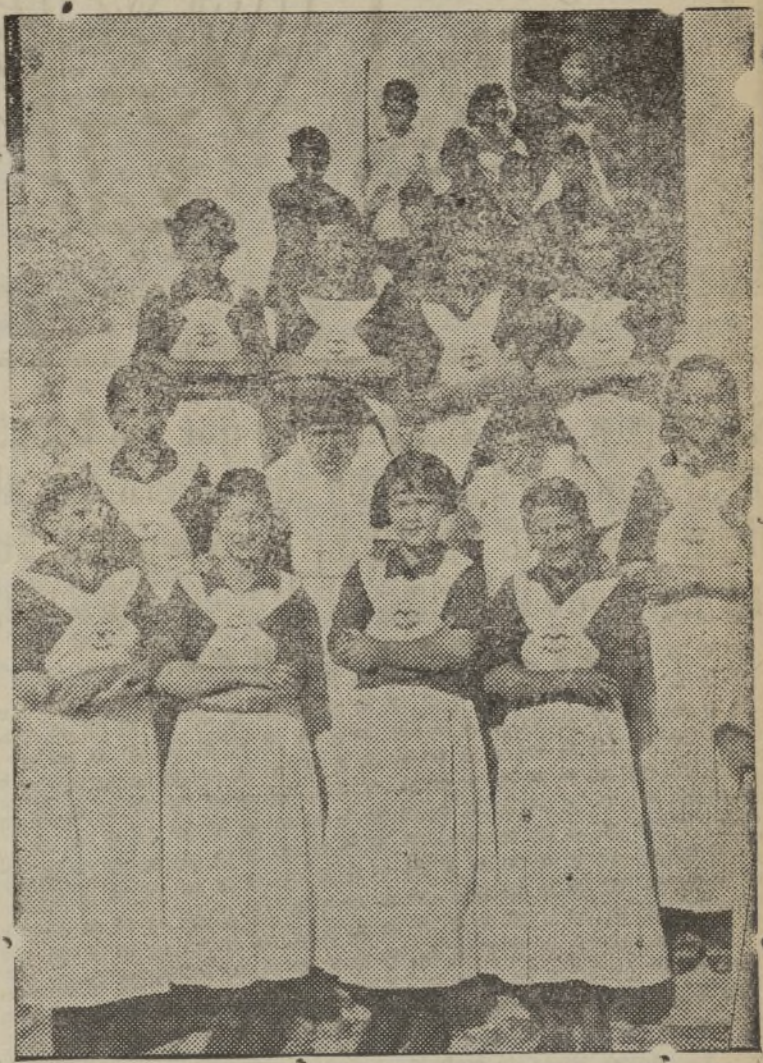
Grupo de camaradas en lo Comedores de "Auxilio de Invierno" de Urbique

Al llegar al Cuartel de Flechas, situado en la Avenida de Portugal,