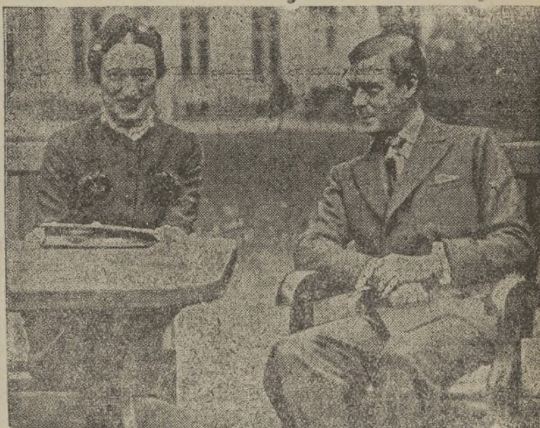
El Duque de Windsor y Mrs. Simpson consienten en retratarse juntos por primera vez. Al indicarle uno de los fotógrafos que adoptasen una actitud feliz, Mrs. Simpson contestó con un "Siempre lo somos", que el Duque corroboró con una sonrisa y un entusiasta "Desde luego".

¡Gloria al caudillo del Norte, general Mola!