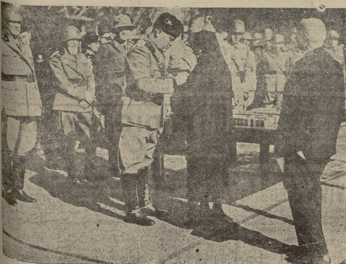
El Duce condecora a las viudas y padres de los muertos por Italia y su Imperio, en la campaña de Abisinia

En lo trágico del momento se les venían a la boca citas y más citas de la Biblia a base de "Caín y Abel", "la madre de los macabeos", "las murallas de Jericó" y "San són y los filisteos". La gente llamaba a la Federica "la bestia predi canda" y a los cuatro oradores. "las cuatro bestias del Apocalipsis".