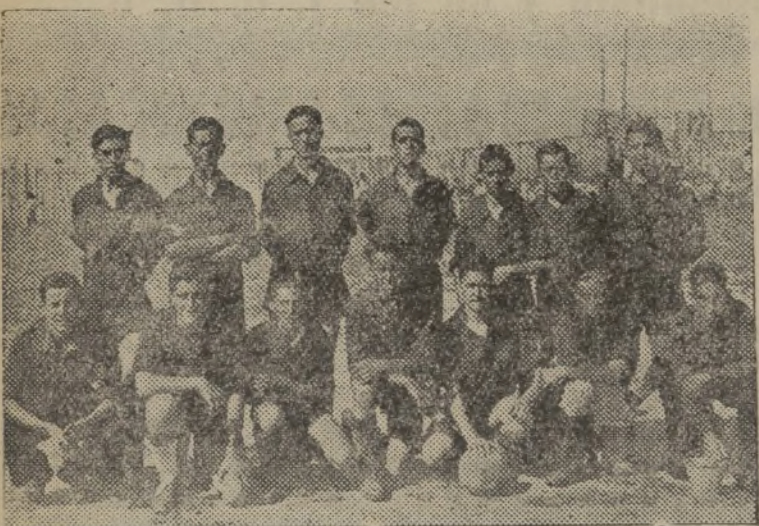
Equipos de los Aprendices de la S. E. de Construcción Naval de San Fernando y conjunto de la Legión de Flechas de dicha población, que han jugado varios encuentros en el Campo de Deportes de Madariaga.