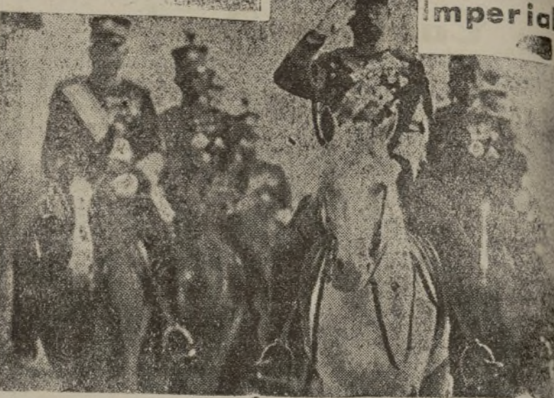
El Japón Imperial

El emperador del Japón, presencia rodeado de su hierática oficialidad una brillante revista militar