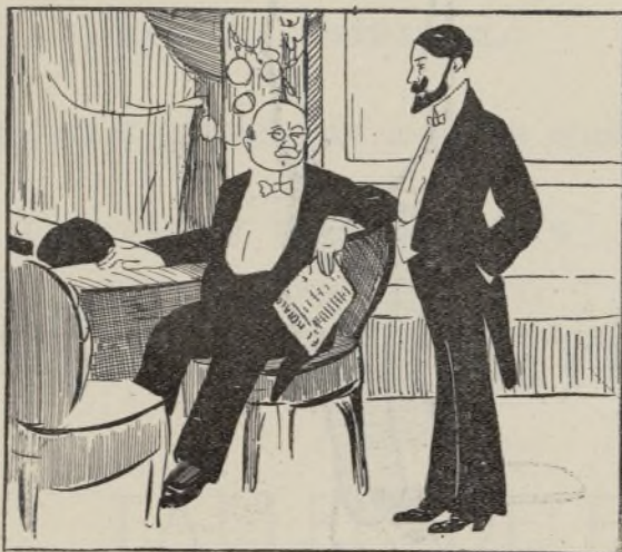
Diálogos en el palco.

—¿Qué haces aquí? —Pues viendo entrar á los Magos. —Pero ¿entran en la Academia? —¡Ya lo creo! Gaspar y Baltasar ya están dentro y ahora va á entrar Melchor..... de Palau.