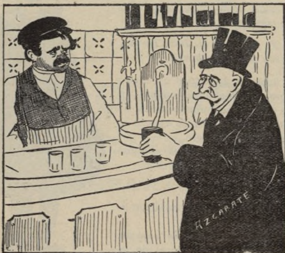
Cuestión de competencia.

—Precisamente por eso. Porque como yo no soy ciego, veo cómo está de barro la calle.