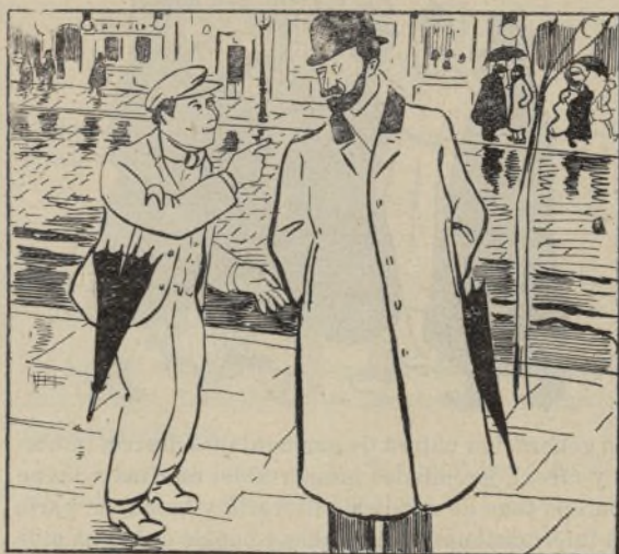
Del Domingo pasado.

—Caballero! ¿me hace el favor de pasarme á la otra acera?