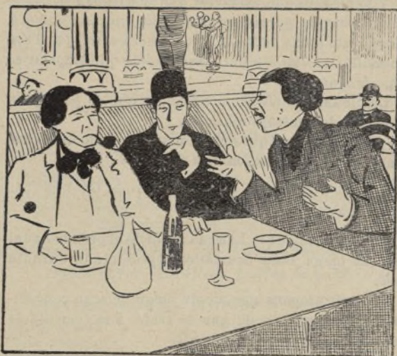
Literatos de «lista chica».

—Hemos estado á punto de sufrir una gran catástrofe. Si hubiesen convertido Fornos en grandes cuerdas, ¿dónde nos hubiéramos reunido?