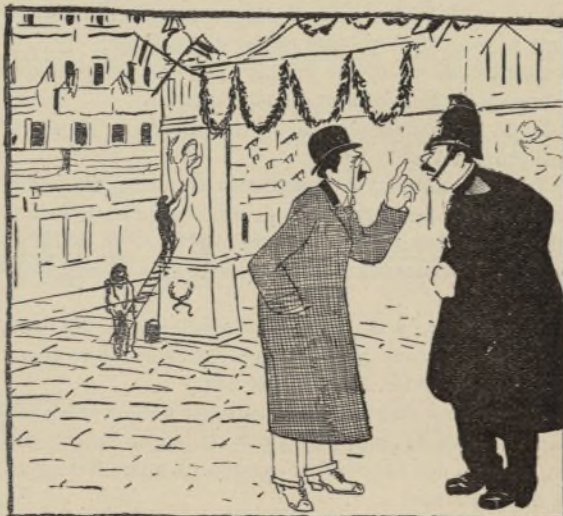
Madrid se engalana.