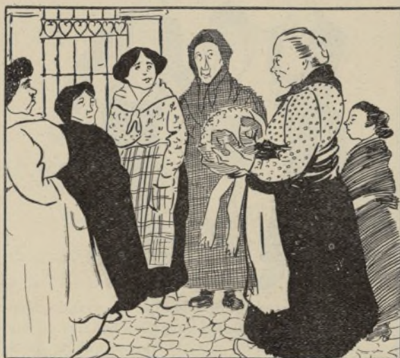
En el barrio de la Paloma

Se dice que el Zar va a estrenar en breve un drama. La noticia no es cierta. El drama del Zar se representa hace ya mucho tiempo en Rusia con gran éxito.