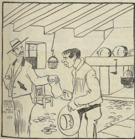
Escenas del cortijo.

— ¿Sabes quién creo que es esa isidra que acaba de pasar por nuestro lado? — No adivino. — Pues D. Jaime de Borbón con refajo y picaporte.