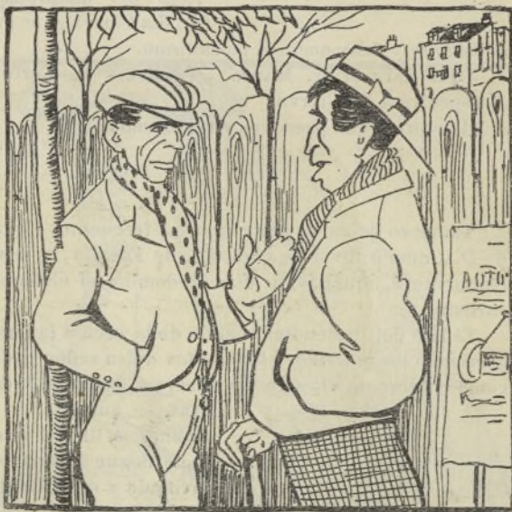
Los premios del natalicio.

— Bueno, Currito. Yo me voy á Sevilla unos días. Ten cuidado de tóo y ahí te dejo las quinientas pesetas para cuando venga el Pernalles.