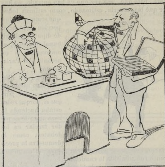
La policía tedesca.

Los asambleístas. — ¡Pillo!..... ¡Traidor!..... ¡Granuja!..... Más eres tú..... Pues, ¿y tú? El Presidente. — ¡Viva la Unión republicana!