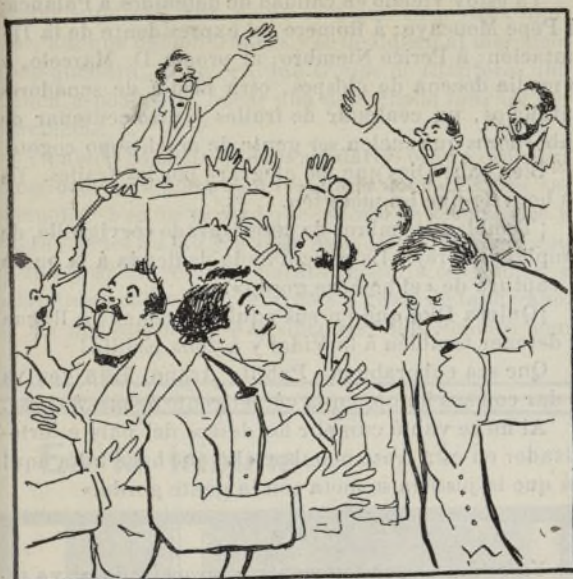
Fin de una asamblea.

Los asambleístas. — ¡Pillo!..... ¡Traidor!..... ¡Granuja!..... Más eres tú..... Pues, ¿y tú? El Presidente. — ¡Viva la Unión republicana!