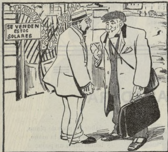
El viaje del Presidente.

—Dime, español; ¿y no tenéis en tu patria algún Caid que os gobierne? —Sí: tenemos al Caid de Mula, Muley La Cierva; pero como vaya a las Cortes ese Caid, ¡se ha caído.... o!