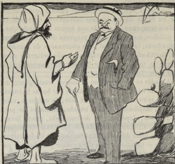
Soriano en Marruecos.

—¿Qué me traes de tu viaje, amado Segismundo? —Pues aquí en la estación no te puedo dar más que un abrazo; pero vámonos a casa, querida mía, y allí pondré en tus manos el bloque de las izquierdas.