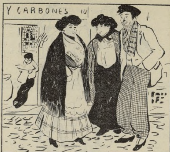
Sobre el «gordo».

—Yo juego siempre con éste, que me da parte en todo lo que lleva y tiene muy buena suerte.