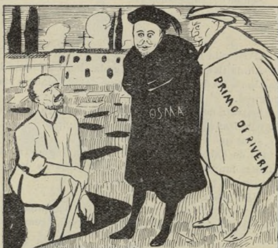
Una escena de Hamlet.

—Eso. Y al pasar te dejas uno en mi casa.