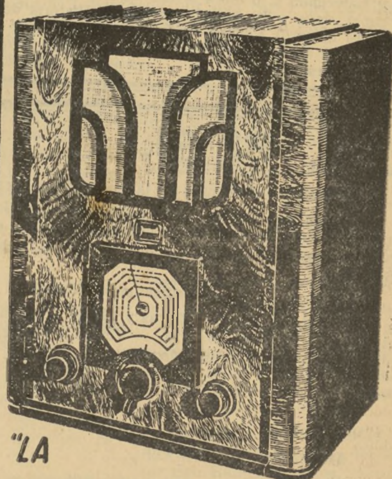
"LA LLAVE DEL MUNDO"

RECEPTODO -Todas las ondas. Mando avión. Antena incorporada. Gran selectividad y sensibilidad en todas las ondas. Gran potencia sonora. Antifading.