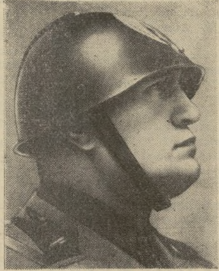
He aquí las dos grandes figuras-Franco y Mussolini-rectoras de dos pueblos próceres, firme baluarte de la civilización cristiana

dadero tesoro: una colección de monedas históricas, 125 monedas de oro francesas y extranjeras, 231 anillos de platino y piedras preciosas, 72 collares y brazaletes de oro, varios objetos de marfil, muchos kilogramos de metales preciosos y varios kilos de dientes de oro. Todo este tesoro representa un valor aproximado de más de un millón y medio de pesetas.