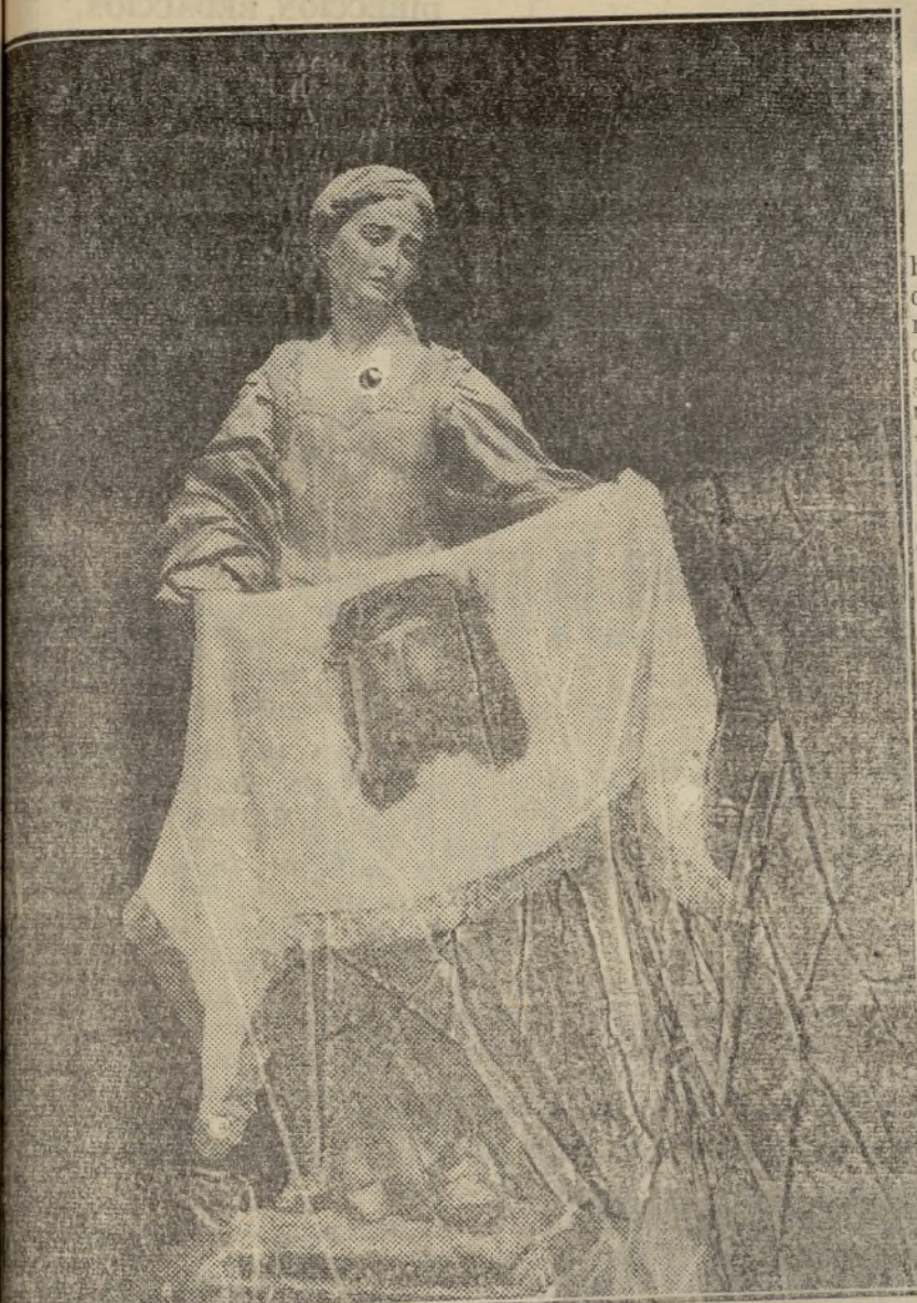
En el camino de la Amargura, la Santa Verónica consuela a Jesús, enjugando su ensangrentado Rostro.