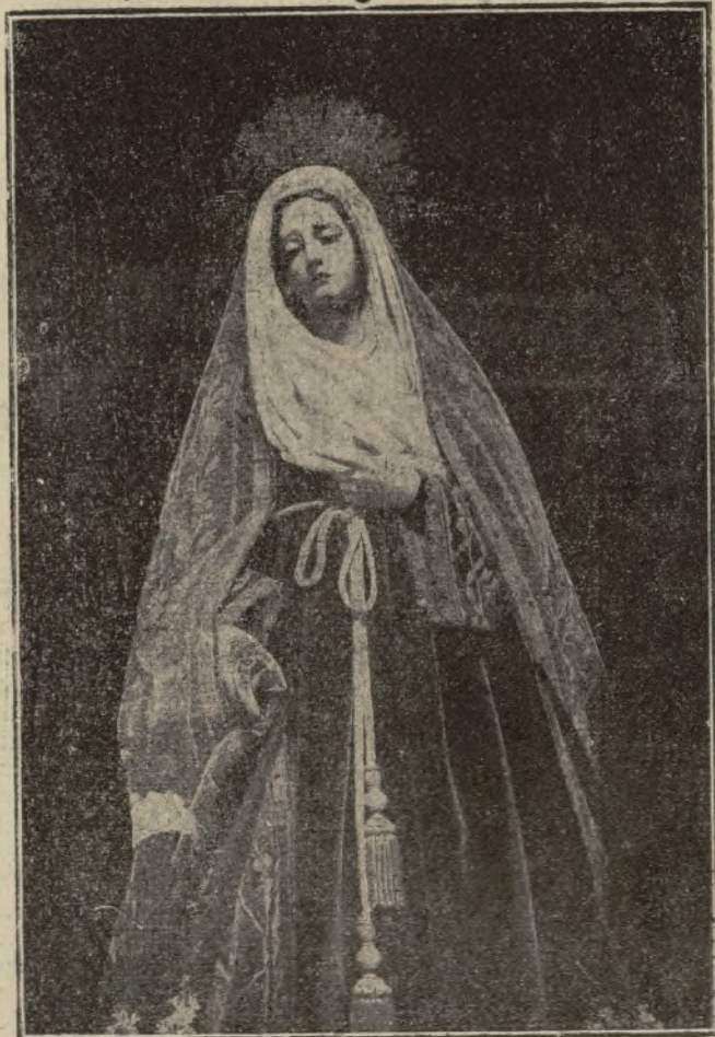
La Madre Dolorosa que hoy recorrerá las calles de nuestra ciudad, partiendo de la iglesia de Santo Domingo.

Por todas partes se ven verdaderas murallas de dos metros de espesor por tres de altura, con numerosos refugios para ametrallado ras. Se trata de una obra construida bajo la dirección de técnicos