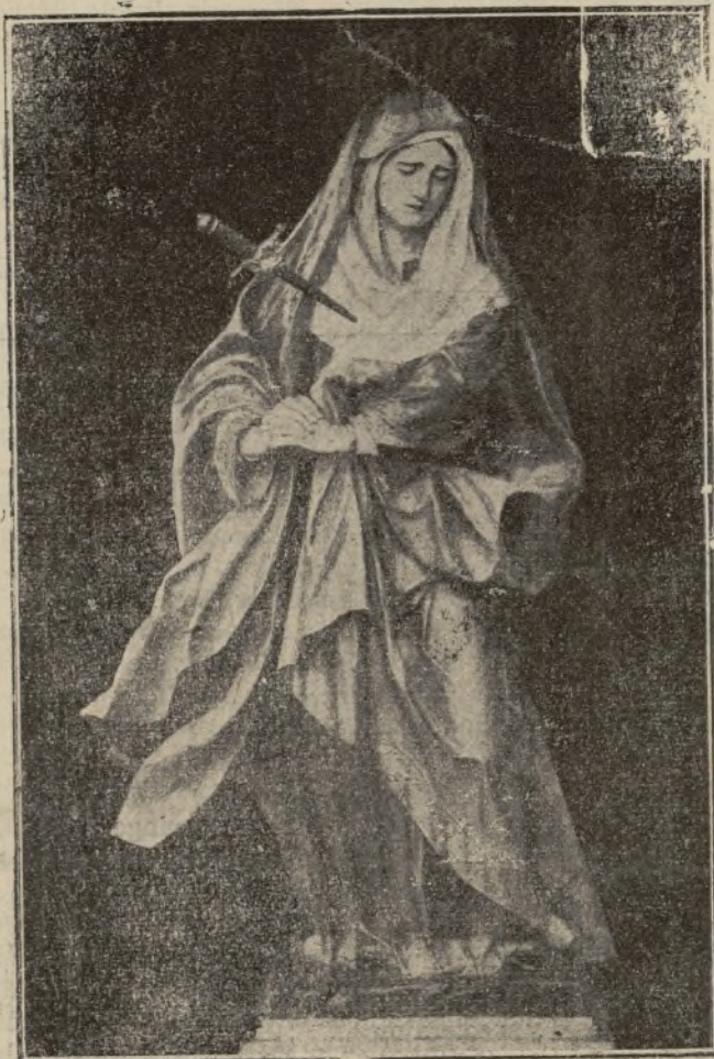
Stabat Mater Dolorosa juxta Crucem, lacrymosa dum pendeat Filius...

vamente y se fijan ratos largos en los suyos; que sus labios cárdenos y fríos se truequen en corales y vuelvan a besarla con cariño apasionado; que sus brazos rígidos y maltrechos puedan abrazarla fuertemente, con ternura, como El lo sabía hacer, porque su Santísimo