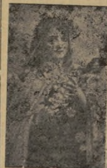
Cultos en honor de Santa Teresita del Niño Jesús en las Siervas de María