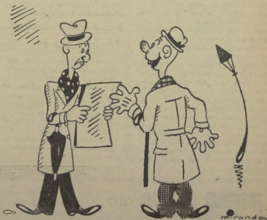
EL UNICO «TRIUNFO», por Miranda

Corresponsales administrativos de las principales casas editoras y de la Prensa Española.