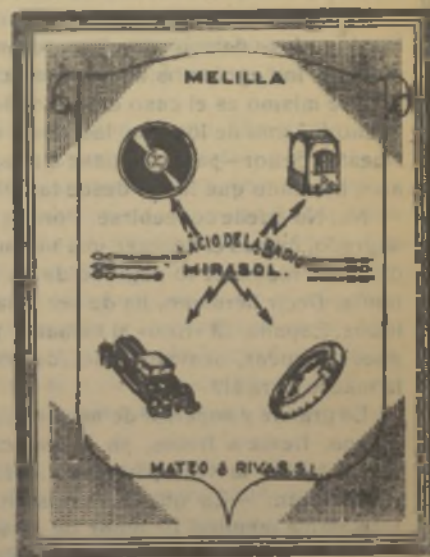
Accesorios para Autos y Radios Actor Tallaví, número 4