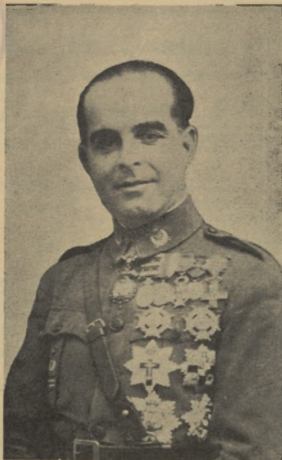
El Excmo. Sr. General Don JOSÉ VARELA IGLESIAS

Redacción y Administración: Cuartel de Falange — Teléfono, 623