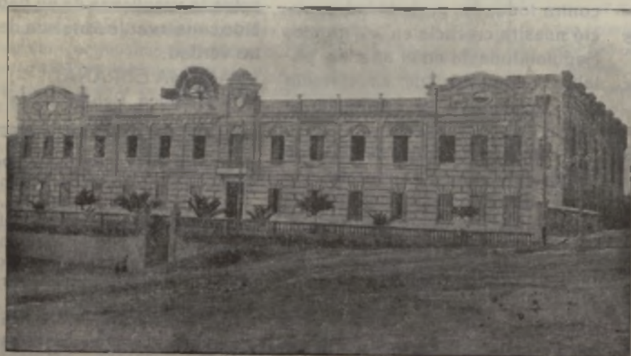
Vista exterior del Colegio de Nuestra Señora del Carmen

A continuación hizo uso de la palabra el Hermano Lorenzo, pronunciando un magnífico discurso, en el que puso de relieve el afecto que todos los Hermanos profesaban a los camaradas caídos, pues no en balde pasaron los años a su lado, educándoles con el cariño y