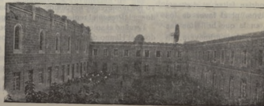
Un aspecto del Patio del Colegio de Nuestra Señora del Carmen, donde tuvo lugar el solemne funeral por los camaradas alumnos, caídos de Falange