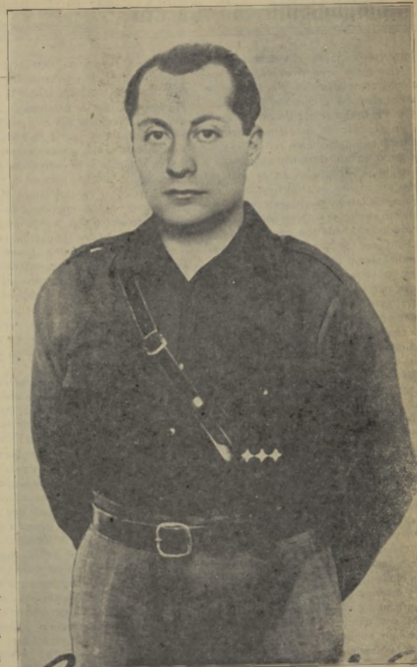
José Antonio Primo de Rivera

La cultura se organizará en forma de que no se malogre ningún talento por falta de medios económicos. Todos los que lo merezcan tendrán fácil acceso incluso a los estudios superiores.