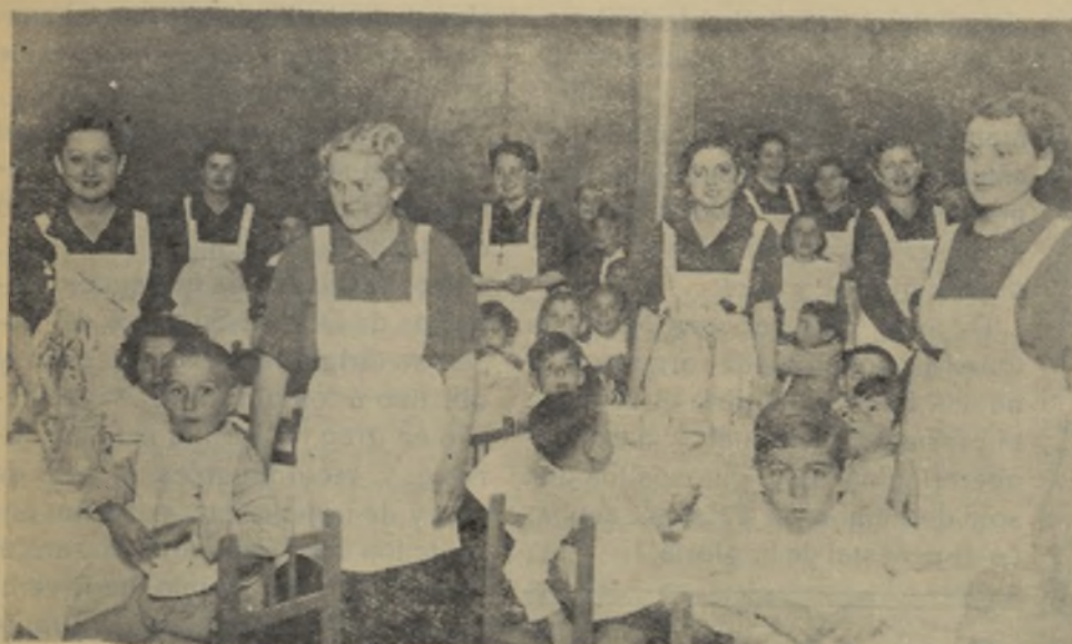
Las camaradas de Auxilio de Invierno sirviendo la comida a nuestros niños