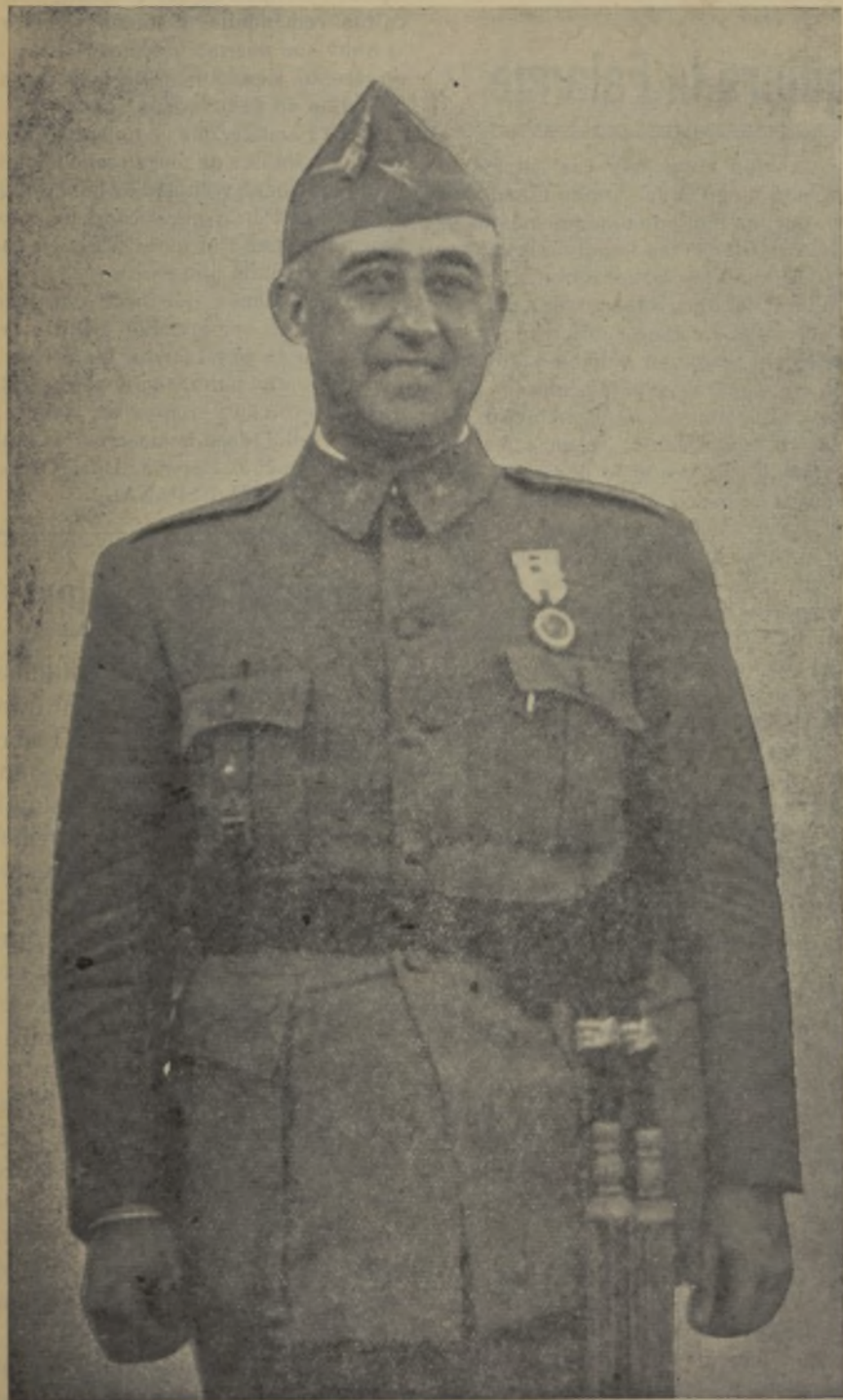
El Jefe del Estado y Generalísimo de los Ejércitos Excmo. Sr. D. Francisco Franco