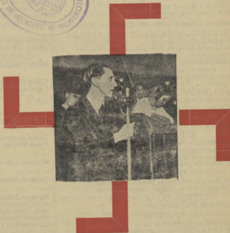
Dr. Joseph Goebbels Ministro de Propaganda del Reich

El bolchevismo es una dictadura de los inferiores. Se apodera del Poder por medio de mentiras y lo mantiene por la fuerza. Para combatirlo, hay que conocerlo a fondo y tiene uno que haber penetrado en sus secretos más íntimos. Todas las fuerzas superiores y morales de una nación tienen que ser movilizadas para aniquilarlo, ya que es un organismo amorfo y antiracial.