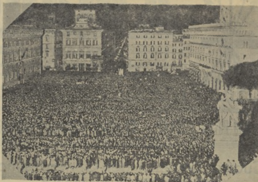
La multitud congregada en la plaza de San Marcos, de Italia, oyendo con gran atención la palabra cálida del "Duce"

El verdadero sentido de la unificación, está en impedir que sigan formándose y multiplicándose las milicias, dando la sensación dispersa de la variedad cuando en esta hora difícil, no hay otro pensamiento que el de salvar a nuestra España, liberándola definitivamente de la pesadilla soviética, hasta