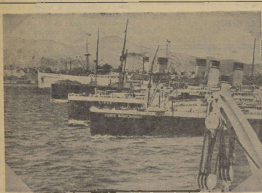
He aquí los navíos «Principessa Giovanna», «Roma», «Liguria» y «Conte Biancamano», en los que fueron transportadas las tropas que conquistaron Abisinia

Al tratar de las Oficinas de Colocación, la Carta del Trabajo manifiesta que el Estado controla el fenómeno de la ocupación y del paro. Las Oficinas de Colocación se hallan bajo el control del Estado. Los patronos tienen la obligación de procurarse trabajadores por medio de estas oficinas y el derecho de elegir