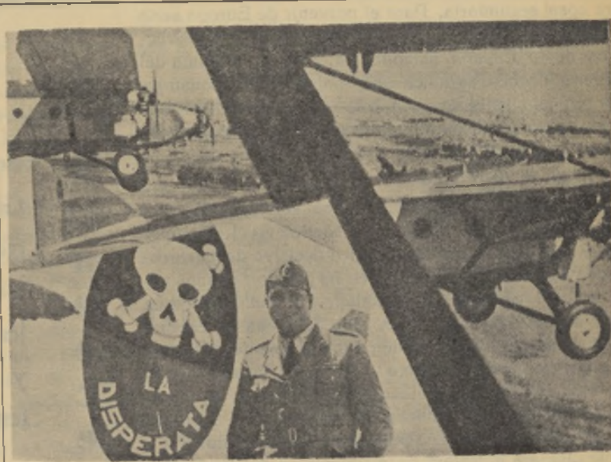
S. E. Galeazzo Ciano, ministro de Prensa y Propaganda, voluntario en el Africa Oriental