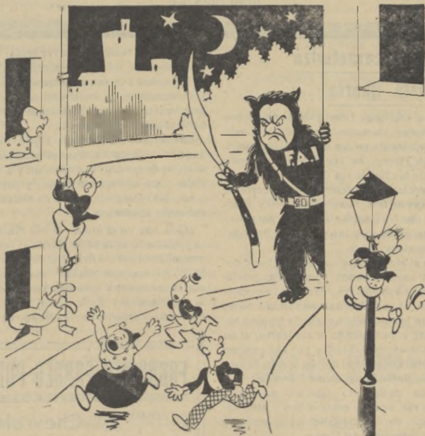
EL «COCO» DE LOS ROJOS

Es inútil que Negrín quiera gobernar ¡caray! mientras quede por allí uno solo de la F. A. I.