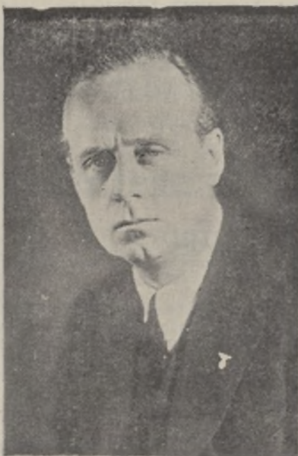
Barón von Ribbentrop, embajador alemán en Londres

todas sus partes, mientras que París y Londres, por consideraciones a los deseos rusos, se han alejado mucho de sus primeras proposiciones en la sucesión de las medi-