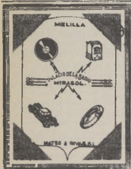
Accesorios para Autos y Radios Actor Tallaví, número 4 - Melilla

España, nuestra Patria querida, nación sin igual en el mundo, tenía asombrados a propios y extraños por su quietud e indiferencia, hacia los múltiples problemas vitales que la azotaban y que solo esperaban, para ver resueltos al hombre patriota e inteligente, con afán de servicio y sacrificio por la sociedad española que languidecía... Pero todos los hombres a una, no atendían nada más que a sus apetitos y ambiciones, dando algunas migajas a los que habiendo perdido por completo toda noción de dignidad, y de ciudadanía, se arrastraban serviles ante el señor ¡y qué señor!, el más inútil y cruel que conocen los siglos. Hay que decir lo sin rodeos, con la claridad de nuestro estilo, que no hay pueblo que cuente con un tipo igual al del cacique español; solo viendo los largos años que fueron soportados se comprende la bondad y riqueza de nuestro país; pero ya afortunadamente han sido borrados para siempre, y con el dolor que ha costado nuestro abandono y desidia, por lo que tan íntimamente afectaba a todos, puesto que era, el ser o no ser, como pueblo, es de suponer no caigamos de nuevo en tan grandes como graves pecados, pues lacras como las sufridas, dejan a los pueblos por mucho tiempo sin alientos de vida. Pero hasta en esto nuestra Patria es única, pues