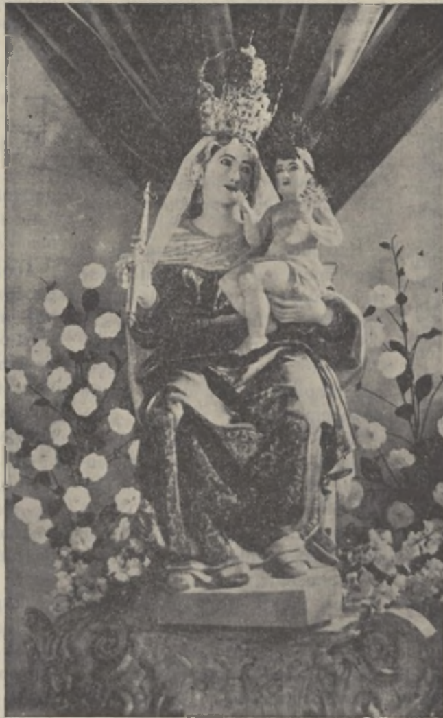
Nuestra Señora de la Victoria, Patrona de Melilla